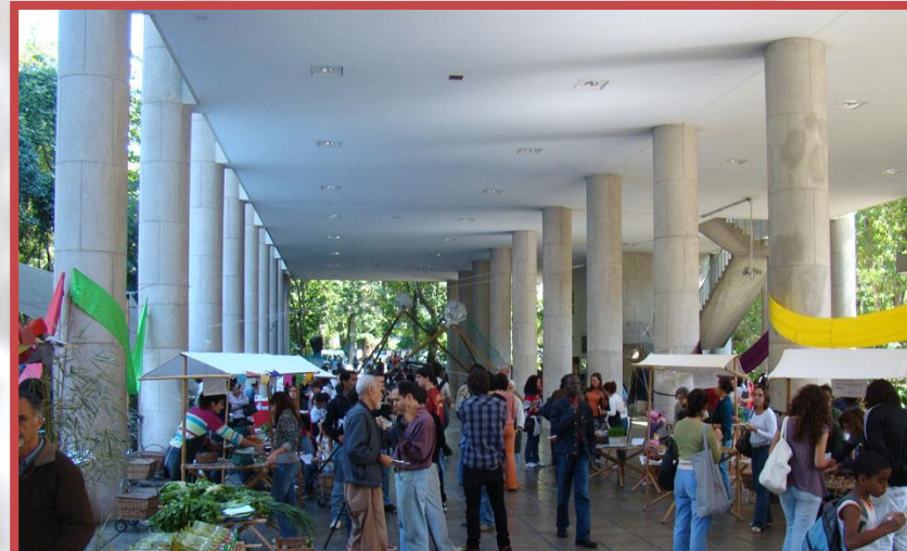
Centro de Ciências Sociais (CCS)