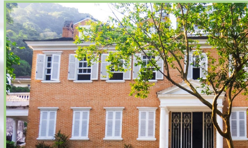
Centro de Ciências Biológicas e da Saúde (CCBS)