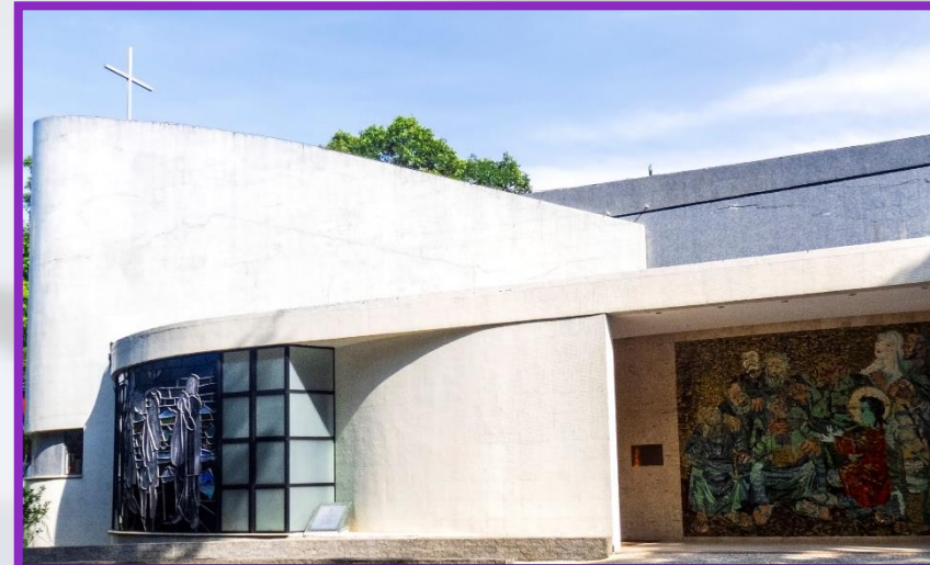
Centro de Teologia e Ciências Humanas (CTCH)